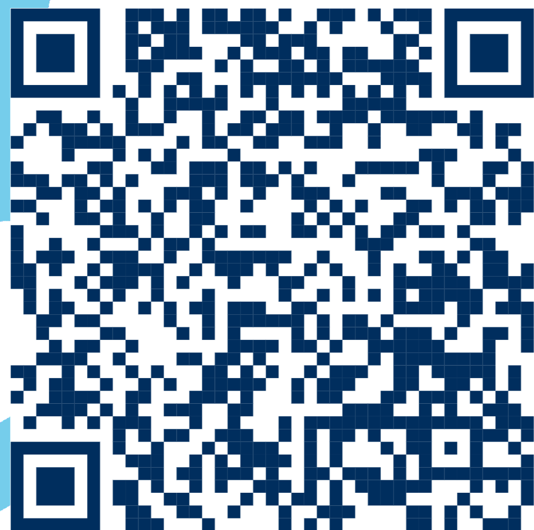
График семинаров на сайте РЭЦ